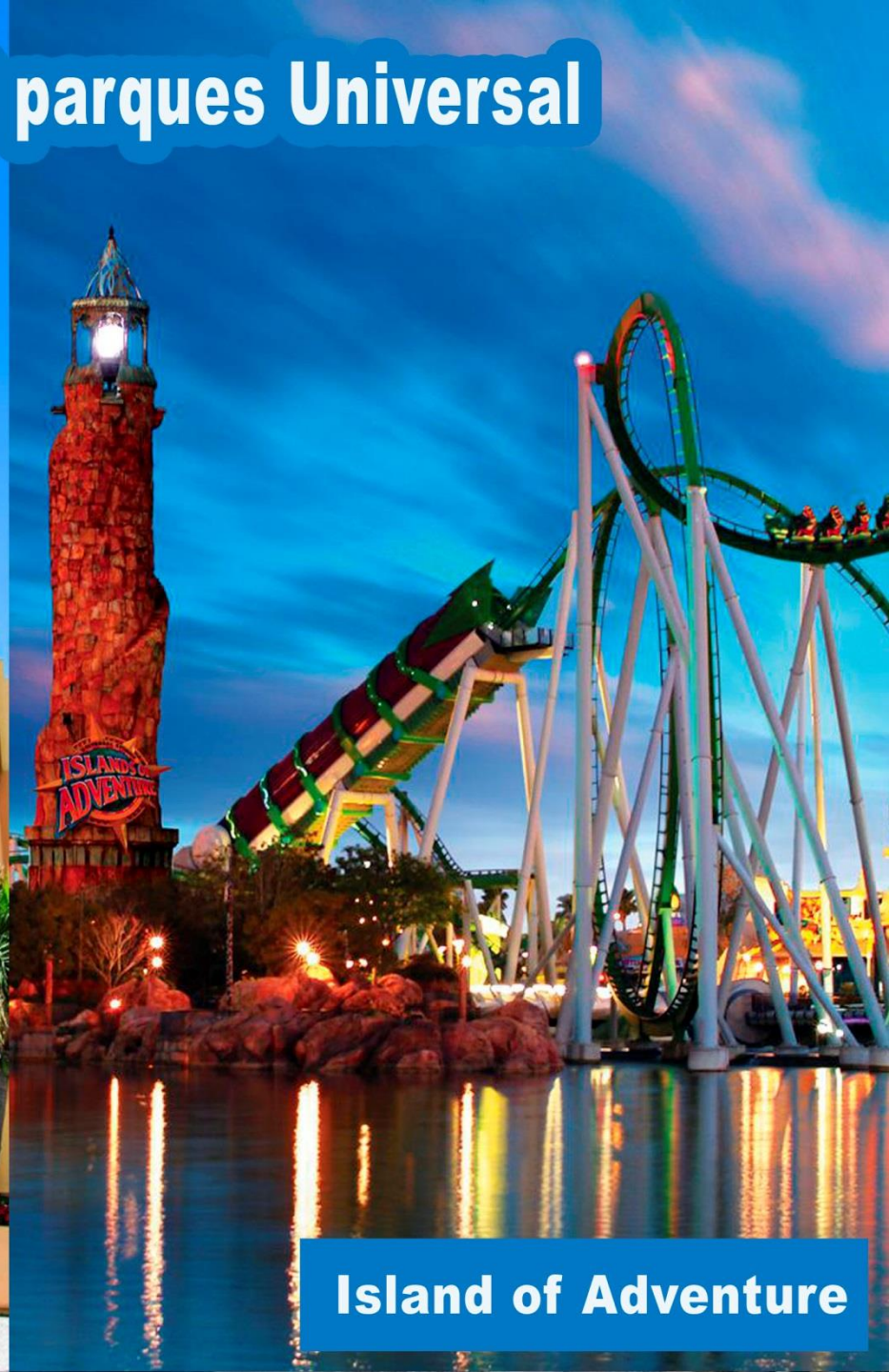
Island of Adventure